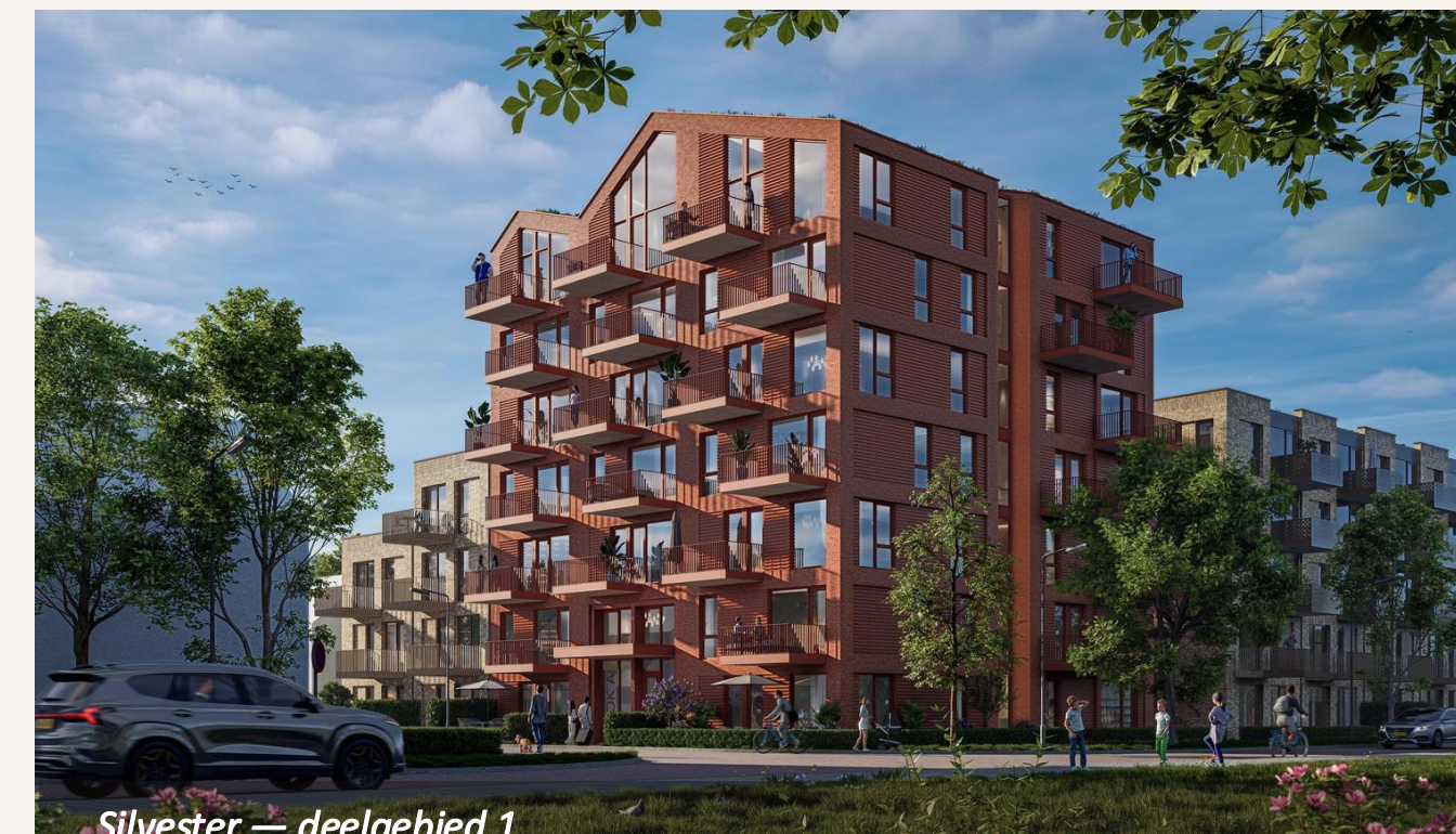
Silvester — deelgebied 1