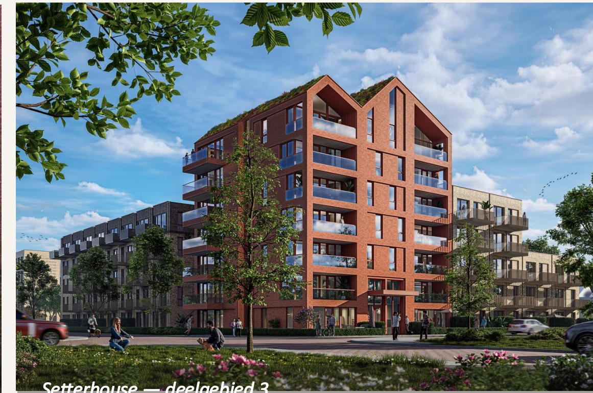
Setterhouse — deelgebied 3