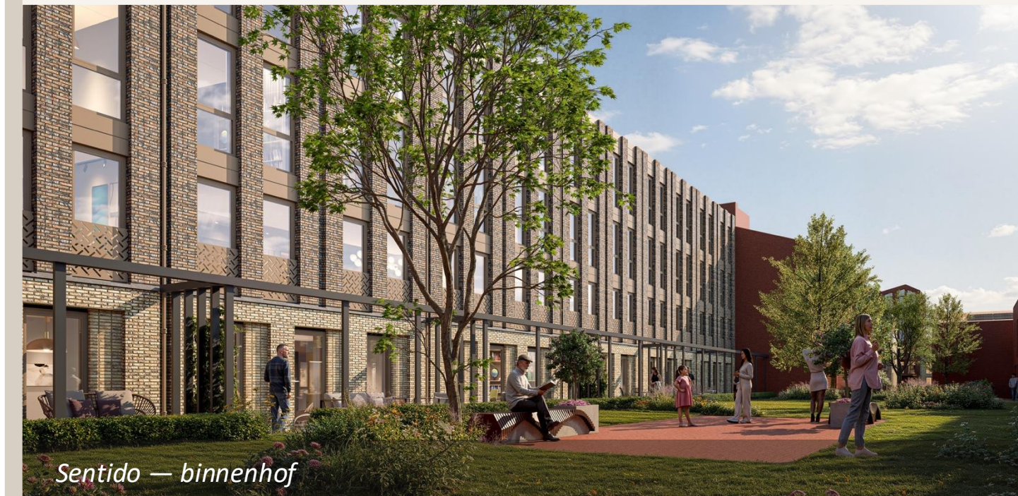
Sentido — binnenhof