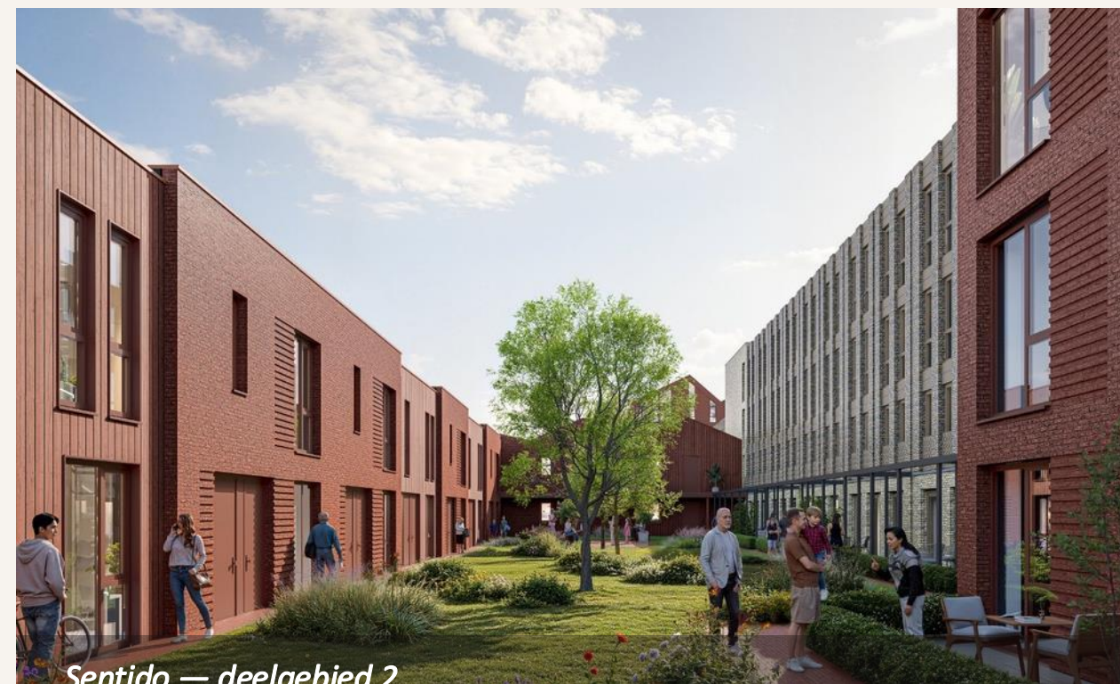
Sentido — deelgebied 2