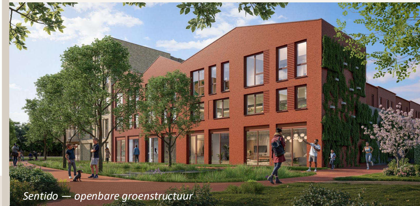
Sentido — openbare groenstructuur